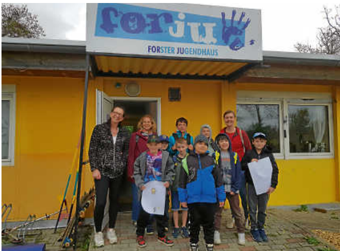
Freudestrahlende Gesichter

Aktuelle Öffnungszeiten auf Instagram forju61 oder auf der Homepage der Gemeinde Forst