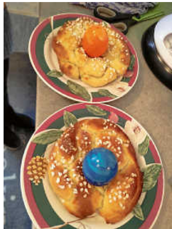
Diese tollen Osternester sind in der Koch AG entstanden

Deswegen öffnen wir das Jugendhaus Montag, den 8. April von 10.00 Uhr bis 16.00 Uhr. UKB frei (über Spenden freuen wir uns immer :))