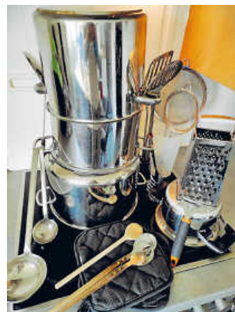
Bald startet die Koch-AG