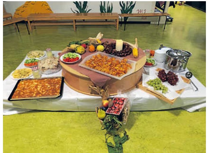
Das leckere Erntedank-Buffer

Nach einem Abschlusslied und einem Gebet war es dann endlich so weit – das Buffet war eröffnet. Die Kinder durften sich an den vielen Leckereien bedienen und gemeinsam in ihren Gruppen essen.