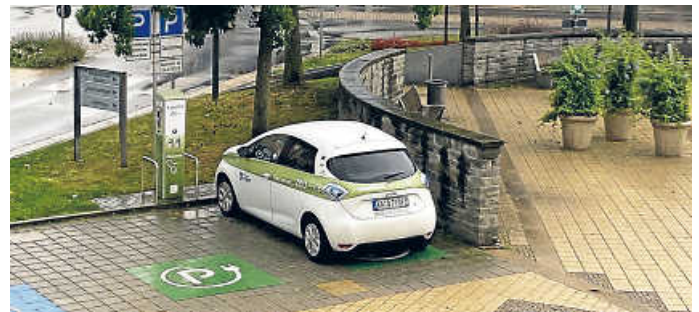
ZEO-Station beim Rathaus am Kirchplatz

In der Region Bruchsal gibt es im Rahmen des ZEO Carsharings über 70 Elektroautos zum Leihen, darunter zwei Fahrzeuge in Forst. Die Modellpalette ist breit. Sie können aus der E-Flotte vom Kompaktwagen bis zum Kleinbus mit 9 Sitzplätzen auswählen. Der Anbieter garantiert attraktive Tarife und einfache Handhabung. Eine Anmeldung ist einfach unter www.zeo-carsharing.de in allen Bürgerbüros der beteiligten Kommunen möglich. In Forst in der Ortsmitte (beim Rathaus) und in der Kronauer Allee/Ecke Hambrücker Straße (Ingenieurbüro IBE) stehen zwei moderne Renault Zoe für die Kunden bereit.