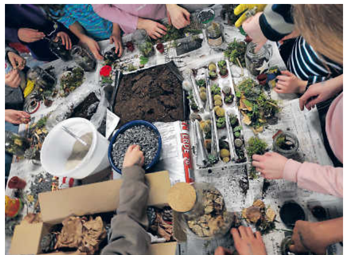
Hier entstehen kleine Flaschengärten