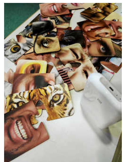
Die Masken und der Minidrucker

Mit Nasenmasken, sogenannten Auf- und Untersetzern, konnten große