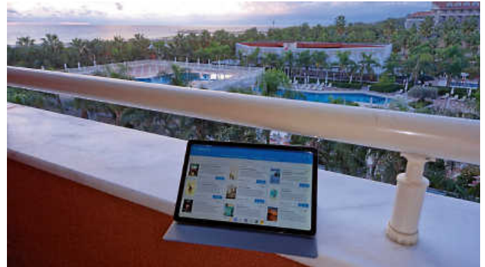
Gewinnerfoto - 2. Platz

Der 1. Platz geht nach Waghäusel (Tablet Levono Tab P11), der 3. Platz nach Ettlingen (in-ear Kopfhörer von Sony), der 2. Platz bleibt in Forst: